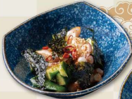
たこと胡瓜のピリ辛和え No. 268 540円(税込594円)