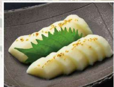
長芋のわさび漬け