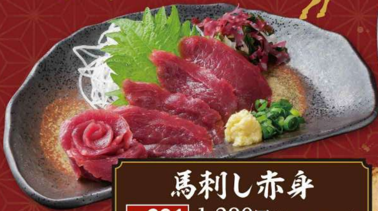
馬刺し赤身 No.291 1,290円(税込1,419円)