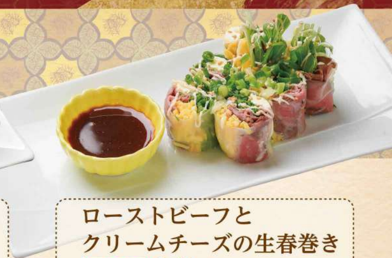
ローストビーフと クリームチーズの生春巻き No.303 840円(税込924円)