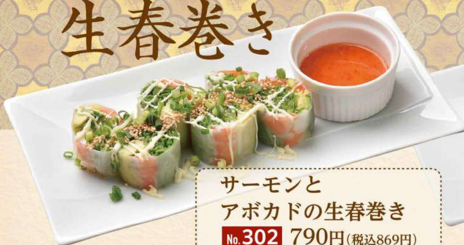
サーモンと アボカドの生春巻き No.302 790円(税込869円)