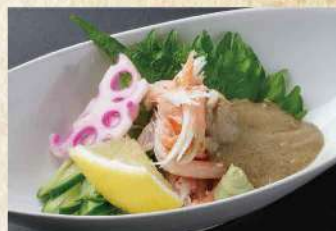
紅ずわいがにのカニ味噌