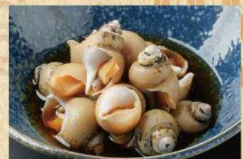
糸魚川産 バイ貝のうま煮