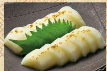
長芋のわさび漬け