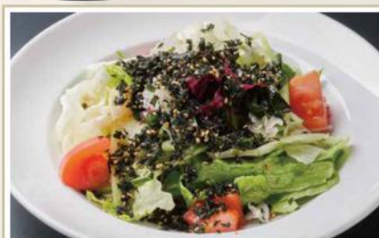
ザクザクわかめの チコレギサラダ