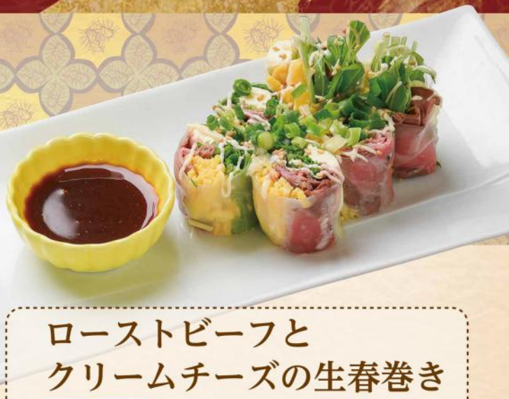
ローストビーフと クリームチーズの生春巻き