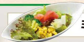
ミニサラダ No.301 340円(税込374円)