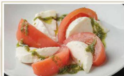
フレッシュモッツアレラチーズの カプレーゼ