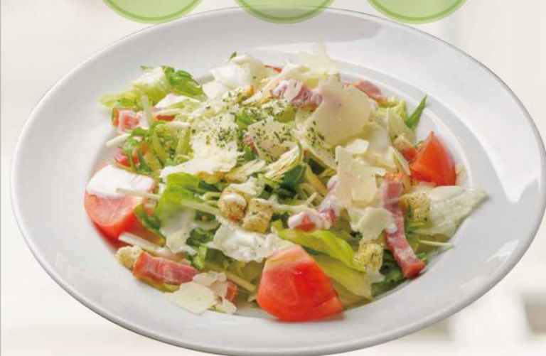
削りチーズのシーザーサラダ