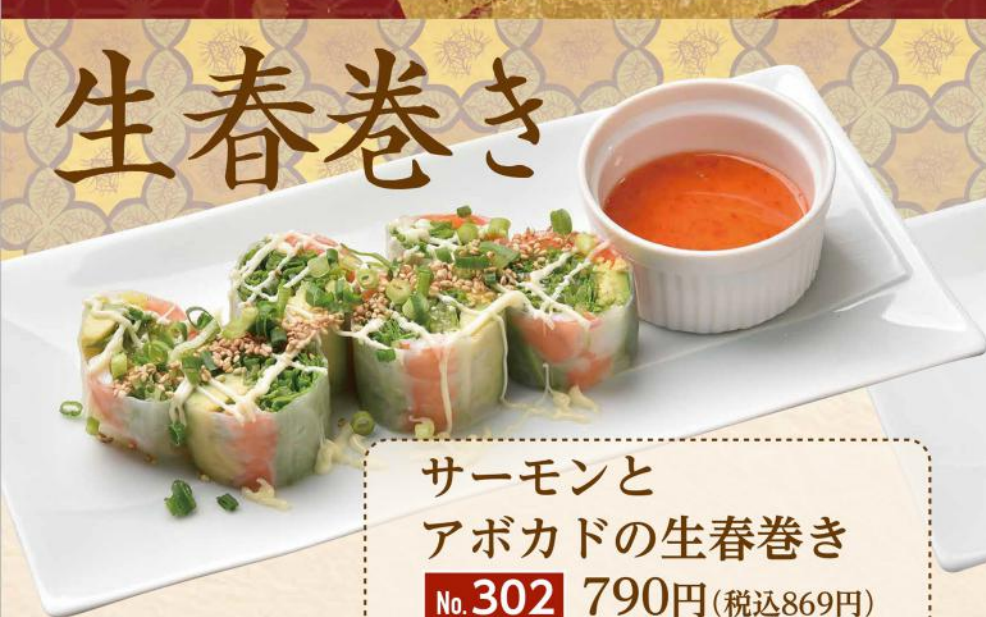
サーモンと アボカドの生春巻き