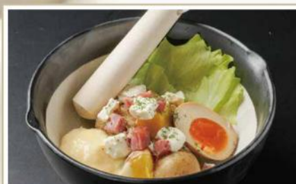
手作りポテトサラダ