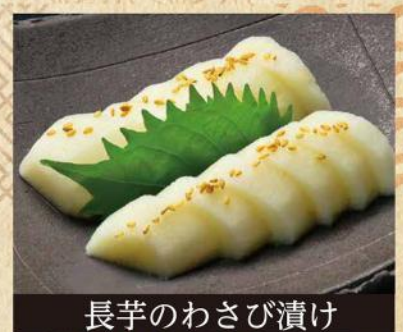
長芋のわさび漬け