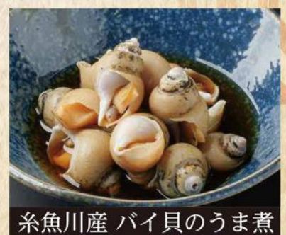
糸魚川産 バイ貝のうま煮