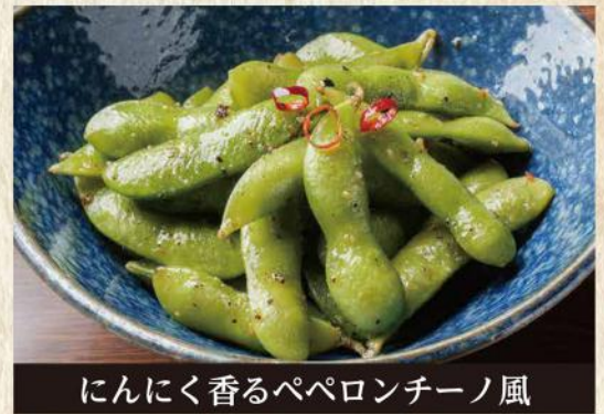
にんにく香るペペロンチーノ風 やみつき枝豆 No. 278 490円(税込539円)