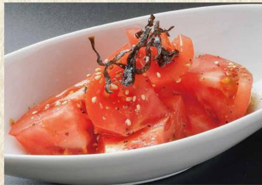
やみつきトマト No. 277 440円(税込484円)