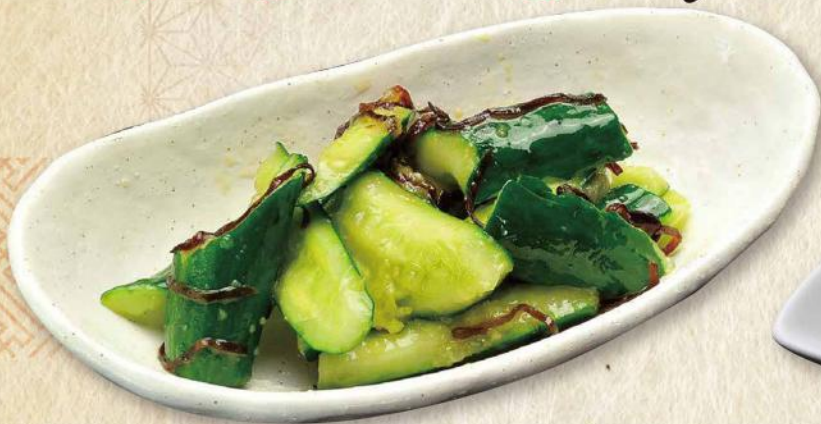
おすすめ やみつき胡瓜 No. 274 440円(税込484円)