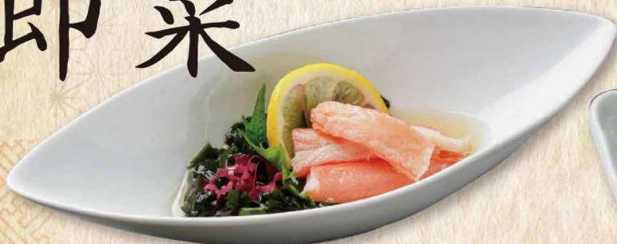
能生産 紅ずわいがにの酢の物 No. 285 740円(税込814円)