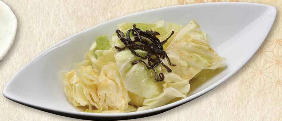
おすすめ やみつきキャベツ No. 275 440円(税込484円)