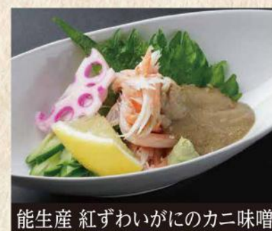
能生産 紅ずわいがにのカニ味噌