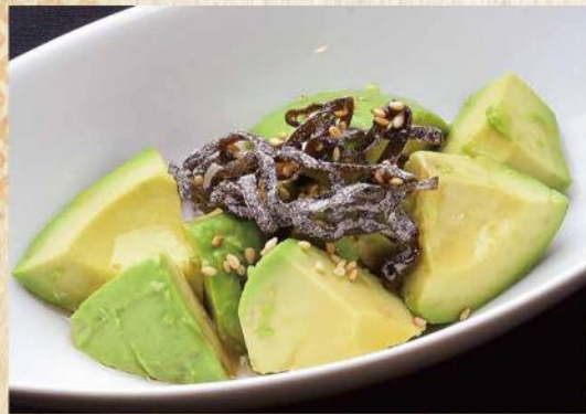
やみつきアボカド No. 276 440円(税込484円)