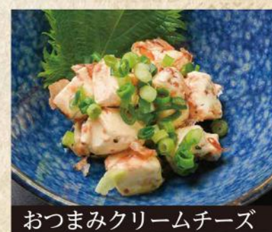
おつまみクリームチーズ