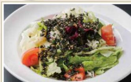
ザクザクわかめの チヨレギサラダ