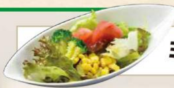
ミニサラダ No.301 340円(税込374円)