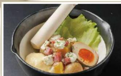
手作りポテトサラダ