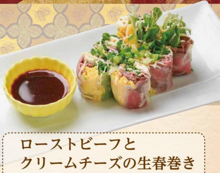
ローストビーフと クリームチーズの生春巻き