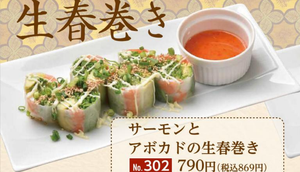
サーモンと アボカドの生春巻き