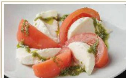
フレッシュモッツアレラチーズの カプレーゼ