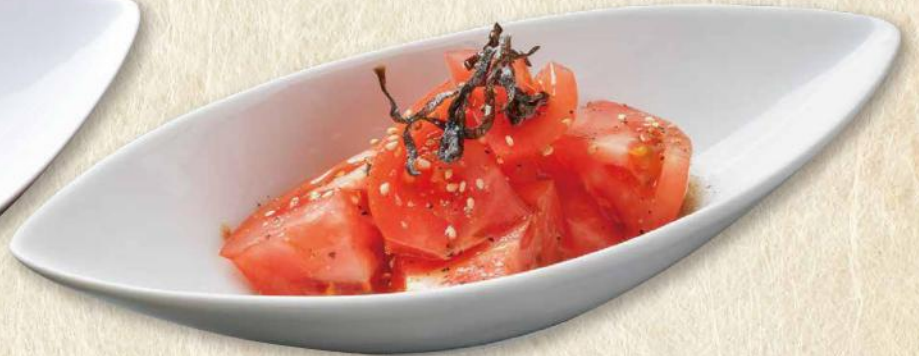
やみつきトマト No.277 440円(税込484円)