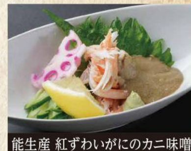
能生産 紅ずわいがにのカニ味噌