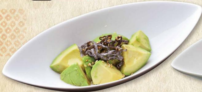
やみつきアボカド No.276 440円(税込484円)