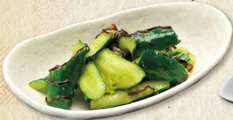
おすすめ やみつき胡瓜 No.274 440円(税込484円)