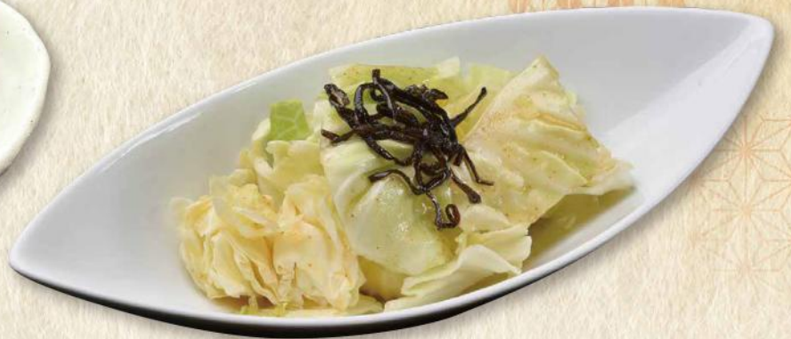
おすすめ やみつきキャベツ No.275 440円(税込484円)