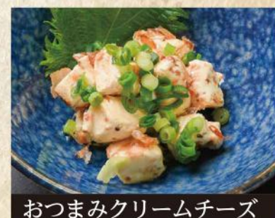
おつまみクリームチーズ