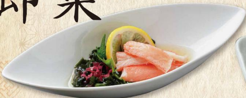
能生産 紅ずわいがにの酢の物 No.285 740円(税込814円)